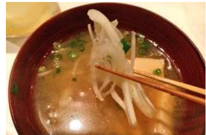
シャキシャキ食感！