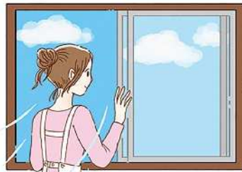
適度な換気も大切。掃除の際や部屋を移動するときなど、ちよつとした合間にする、おっくうになりませんよ。