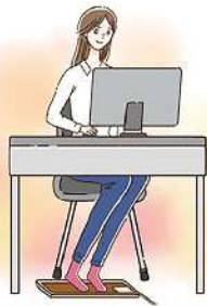
足元に置いて使うミニサイズのホットマットはリモートワークにおすすめ！効率良く足元を温めることができます。

コントローラーの故障を防ぐため、上には何もかぶせないようにご注意ください。座卓、ダイニングテーブルなどと併用する際は、テーブルの脚や椅子で電熱線を踏まないことも大切。長期間使用による劣化も心配ですね。折りたたんだときに、電熱線のボキボキという音が聞こえたり、本体の表面が破けたりしていたら、使用をやめて、買い替えましょう。