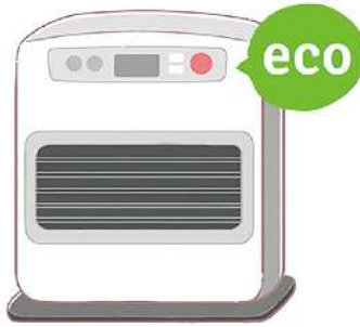
暖房器具は、暖めすぎを防ぐエコ運転などを利用するのも良いですね！