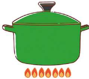
お湯を沸かすときはフタをすることで、熱が逃げるのを防ぎ、早く沸くので省エネにつながります。

料理のときに、煮込み料理は長時間火にかけなければいけません。短時間で仕上がる圧力鍋や、保温性が高い鍋を使うことも手です。保温性が