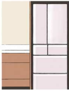
冷蔵庫の側面も放熱するので、5ミリ以上、すき間を開けて設置すると良いですよ

冬などは、食品の入れ具合にもよりますが、設定温度を弱にすると、消費電力が少し節約できることがあるそうです。ほかに、省エネモードがあれば、より少ない電力で稼働するので、ぜひ、取扱説明書をチェックしてみてください。