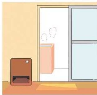
湯上りに脱衣所が寒いのも危険なので、脱衣所を暖めましょう

また、だんだんと、花粉症も気になる時期。お風呂で鼻からゆっくり湯気を吸って口から吐く深呼吸を数回することで、鼻づまりの緩和が期待でき、鼻のどを保湿してくれる効果もあります。朝風呂が好き、という人もいますね。体がシャキッとして良いところも