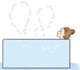
10〜15分ほど浸かるのがおすすめです！

かからず、筋肉もゆるんでリラククスできます。ぬるく感じるかもしれませんが、ゆっくり浸かると、体がぽかぽか温まりますよ。